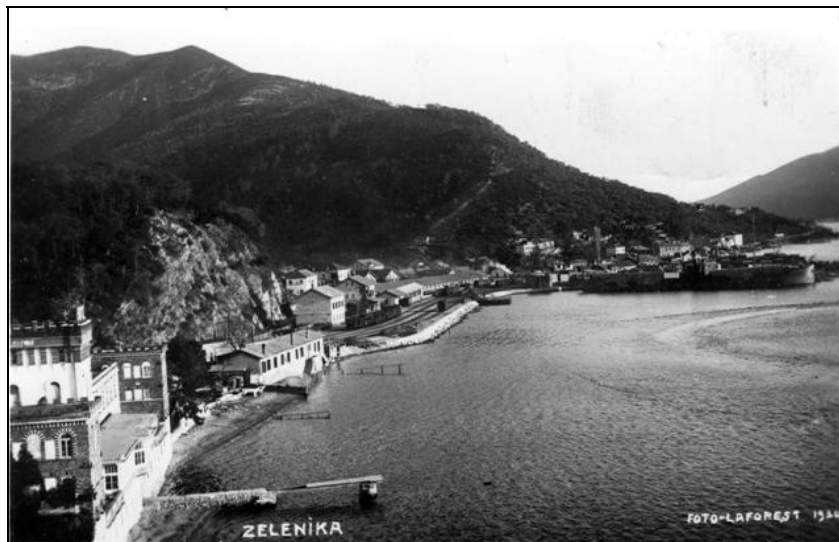
Hotel "Plaža" Zelenika